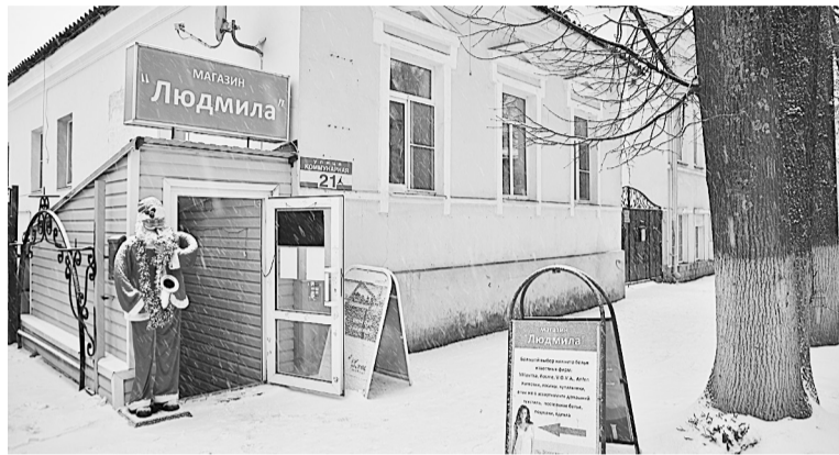
Магазин «Людмила» ждёт вас по адресу: ул. Коммунарная, 21 (напротив городской стоматологии). Участвуйте в розыгрыше и настройвайтесь на волну новогоднего настроения!

стикового окна или застекление лоджии. Чем больше купонов, тем больше шансов на выигрыш. Специальный приз — сертификат магазина «Натя» на сумму 3000 рублей — ждёт покупателя, накопившего наибольшее количество купонов. Подробности розыгрыша узнавайте у продавца или читайте в «Красной искре» (№ 49 от 3 декабря).